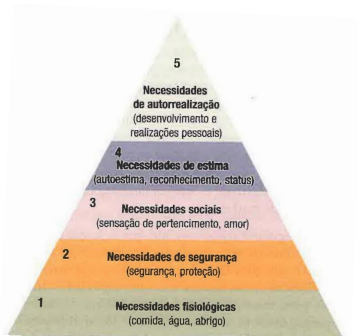
Figura 1 – Hierarquia das necessidades de Maslow