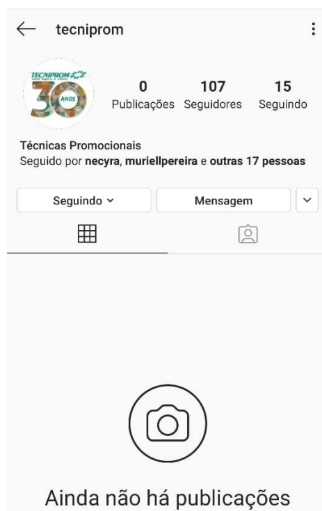
Ilustração 1 - Cenário inicial dos Instagram da Empresa.

Um dos pontos fracos da empresa, pode ser observado na figura a seguir. Ao observá-la, fica claro que a empresa não fez nenhuma publicação em sua página, de modo geral, não atraindo possíveis clientes.