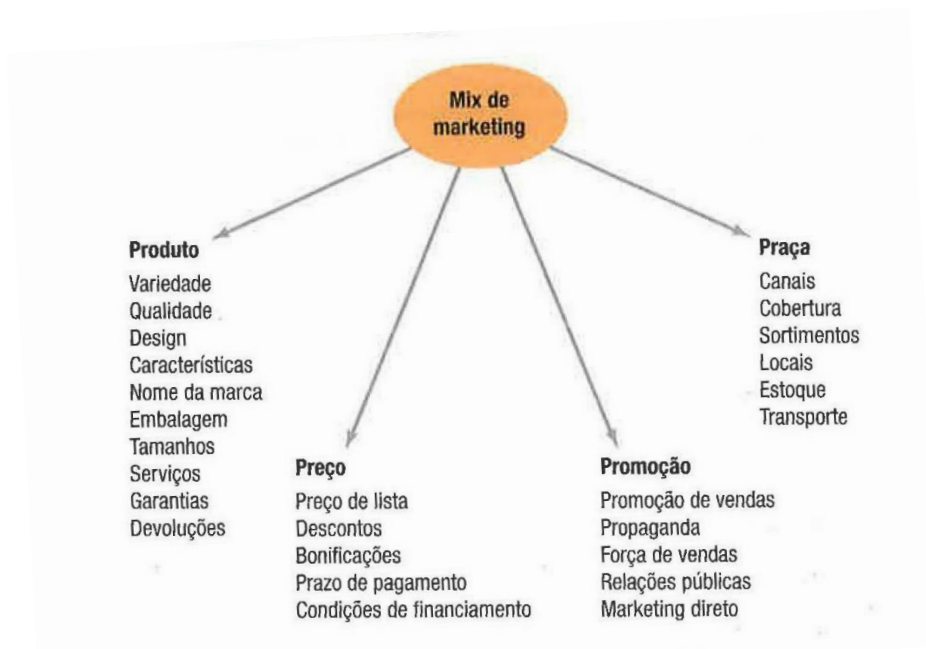
Figura 2 – Os 4Ps do Mix de Marketing